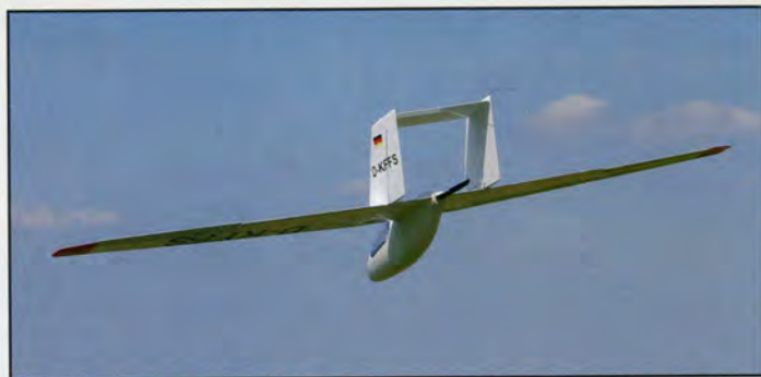
Au moteur, la FS 26 pourra voler en plaine sans l'aide d'un remorqueur.

Les panneaux extérieurs sont également construits sur la base de