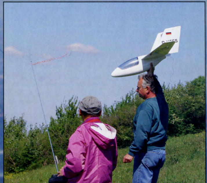
La prise en main au centre de gravité est très bonne.

Le panneau central sera découpé dans du polystyrène expansé puis coffré avec du samba de 0,6