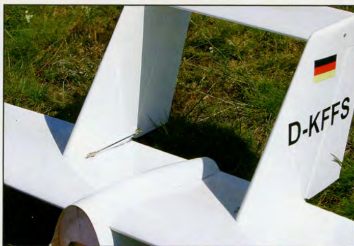
Une vue sur une commande de direction.