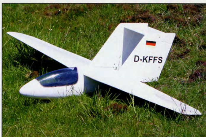
Comme souvent sur les ailes volantes droites, les dérives sont de très grande surface.

Le fuselage a été peint à la glycéro blanche. Les ailes, les dérives et le stab horizontal ont été entoilés à l'Oracover blanc puisque,