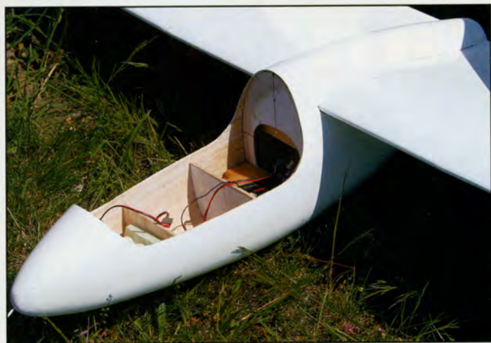
Cabine ouverte, la structure monocoque du fuselage est bien visible.

sera de part en part le panneau. Il faudra aussi, par la suite, percer dans le polystyrène les passages pour les différents câbles de servos ainsi que le passage de l'an-