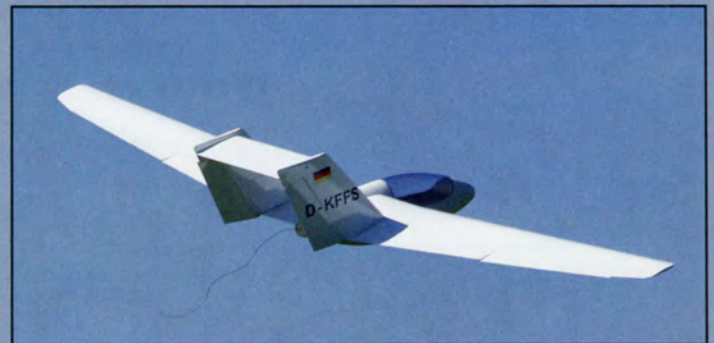
Elle n'est plus toute jeune, et pourtant, la ligne est quasi futuriste !

Quand tout sera sec, il faudra remplacer les couples D et H en balsa par des homologues en ctp et coller quelques renforts de tissu de verre à l'intérieur du fuselage notamment à l'emplacement du couple moteur et de la traverse de fixation de l'aile, pour donner de l'aisance à cet endroit, il sera pos-