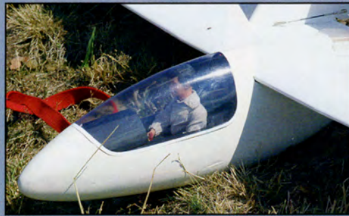
Avec un pilote, le fuselage est encore plus sympa !

Découpez maintenant le contour de la verrière ainsi que l'assise de l'aile dont la partie récupérée servira de capot d'aile. Pour le tracé