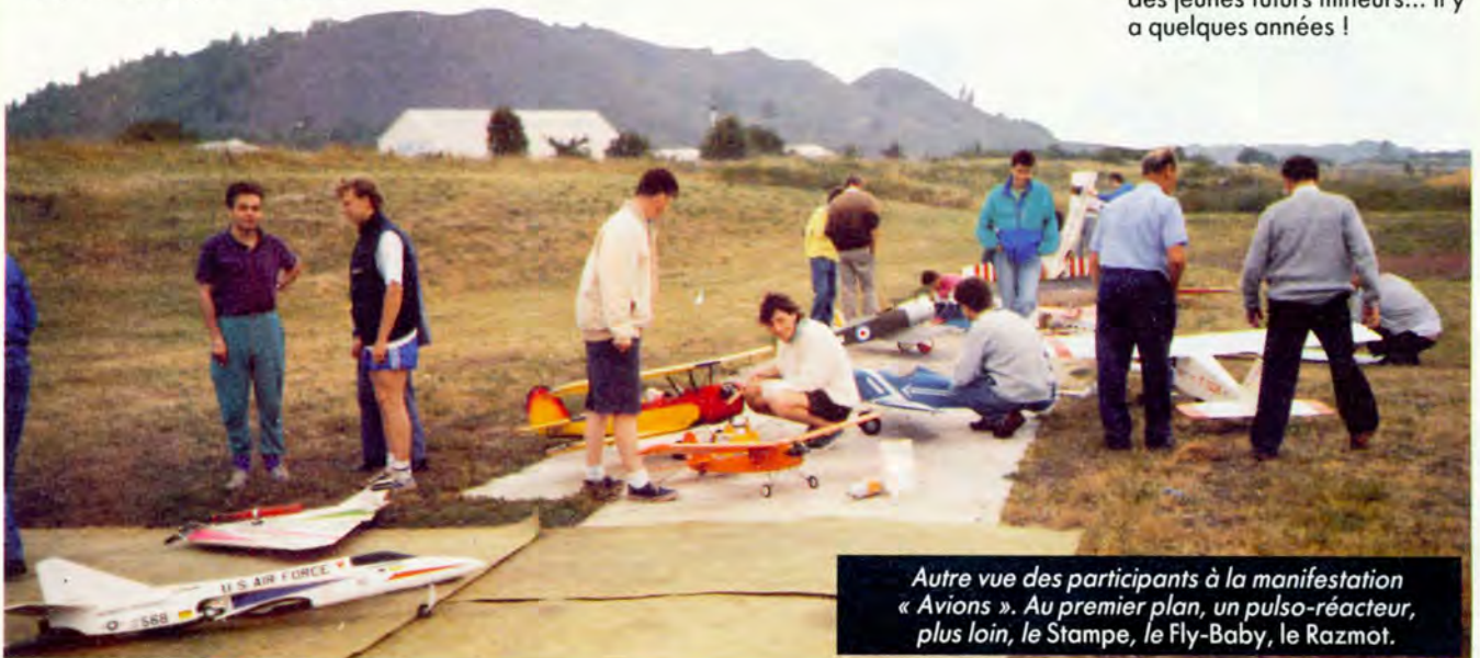
Autre vue des participants à la manifestation « Avions ». Au premier plan, un pulso-réacteur, plus loin, le Stampe, le Fly-Baby, le Razmot.

Après-midi. Pas de répit ! Dès la fin du repas, retour à la MJC où nous nous installons dans la salle Braessens, magnifique salle de réunions et de spectacles. L'emploi du temps prévoit une séance de discussions. Celles-ci commencent donc. F. Thobois, face à l'auditoire, répond aux questions qui fusent bientôt de tous côtés. Bien sûr, on parle beaucoup du Supertef, la dernière création de l'auteur. Quelques points sont éclaircis ! Eh oui, l'exponentiel est prévu ! Comment obtenir la dernière version du soft ? Peut-on faire ceci ou cela ! Le directeur de Génération-VPC est présent ! Il est mis sur le gril ! Le temps passe trop vite ! A 18 heures, les participants sont invités à une visite de la « mine-image », reproduction fidèle du fond d'une mine de charbon, avec ses galeries, ses tailles... « mine-image » qui servait à l'apprentissage des jeunes futurs mineurs... il y a quelques années !